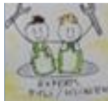
LVB Proof zorg

Na lange tijd weer een nieuwsbrief.. Wat vinden jullie? Voor herhaling vatbaar? Laat het even weten via deze link !